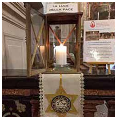
"La luce della pace" esposta nella chiesa parrocchiale