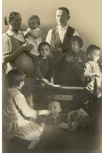
Jozef e Wiktorja Ulma e i sette figli

La nostra Comunità saprà mantenere e portare avanti queste testimonianze? Papa Francesco ha richiamato l'attenzione per una Chiesa che è tornata a essere "Chiesa di martiri" dove in alcuni casi anche soltanto partecipando all'Eucaristia domenicale significa rischiare la vita. Tanti sono i "nuovi martiri", Papa Francesco il 10 settembre 2023 ha beatificato una numerosa famiglia polacca vissuta più di 80 anni fa. Il 24 marzo 1944 nel villaggio di Markowa viene sterminata la famiglia Ulma: padre, madre con i loro 6 figli e un piccolo ancora nel grembo della mamma già pronto per la nascita. I nove sono stati soppressi perché "colpevoli" di aver nascosto nella loro casa otto ebrei di tre famiglie, uccisi con loro lo stesso giorno. La famiglia Ulma che in Polonia conoscono come i "samaritani di Markowa" con il suo gesto ha evidenziato la totale adesione al Vangelo scegliendo di proteggere la vita a costo della vita. È pertanto significativo che una famiglia intera sia stata beatificata per aver aiutato degli ebrei: "Nessuno ha un amore più grande di questo: dare la vita per i propri amici" (Gv 15,13). È inoltre importante il fatto che tutti i figli vengano beatificati insieme ai genitori, e a causa del Battesimo di sangue, sia stato beatificato un bambino che era ancora nel grembo della madre, fatto che non era mai accaduto prima. A questa famiglia di beati, in un tempo dove il valore della famiglia si sgretola sempre più, verrà mai dedicata una Chiesa o una Parrocchia?