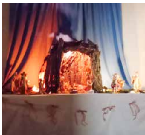
Il Presepio nella chiesa parrocchiale

Amministrazione chiesa Magliasina 6987 Caslano