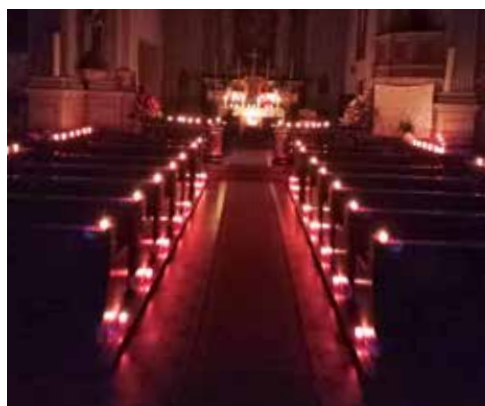
Messa "Rorate", alla luce delle candele, celebrata nella chiesa di Caslano il 19 dicembre 2023