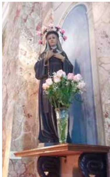
Statua di santa Rita a San Sisinio alla Torre a Mendrisio

Perché la benedizione delle auto? È alla devozione popolare che si deve la definizione di Santa Rita come «protettrice degli automobilisti». È infatti una tradizione nata intorno al 1930, forse ricondotta all'episodio del «volo notturno» di Santa Rita. Si narra che Rita, a coronazione del suo grande desiderio sin da fanciulla, chiedesse al monastero agostiniano di S. Maria Maddalena di accoglierla. Di fronte al rifiuto delle monache probabilmente per la sua condizione di vedova e per le vicende familiari legate all'omicidio del marito, Rita entra miracolosamente di notte, accompagnata da S. Agostino, S. Nicola da Tolentino e S. Giovanni Battista, che dallo scoglio di Roccaporena la trasportano fino dentro le mura del monastero a Cascia.